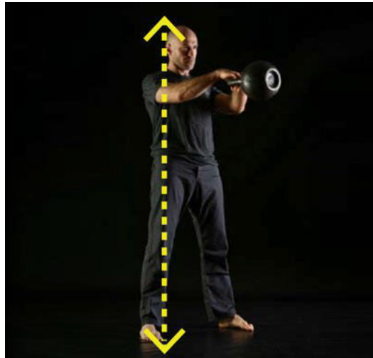
Obr. 3 Horní pozice swingu.

1) horní část – bell se na zlomek vteřiny zastaví ve stavu beztlíže, ramena jsou uvolněná a stále stahována od uší, bell je stále v prodloužení předloktí, hýždě jsou maximálně stažené, nezaklánět v bederní oblasti, krátký silový výdech do pevného břicha (rychlé silové „zasyčení“), kolena jsou propnutá (obr. 3).