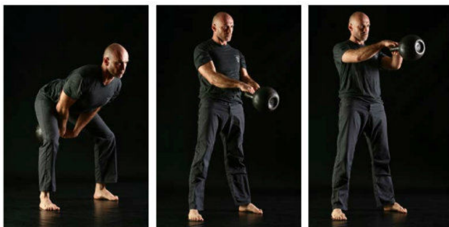
Obr. 5 Pŕechod do horní polohy swingu.

4) přechod ze spodní do horní části – zde je nutné aplikovat rychlou a výbušnou sílu kyčlí směrem vpřed se současným propnutím kolen, ramena nezvedají váhu kettlebellu, chodidla stále pevně zapouštět a stabilizovat do podlahy, v horní poloze opět stejná pravidla. Silový výdech, pŕlky k sobě, propnutá kolena, krátký „relax“ ve stavu beztlíže.