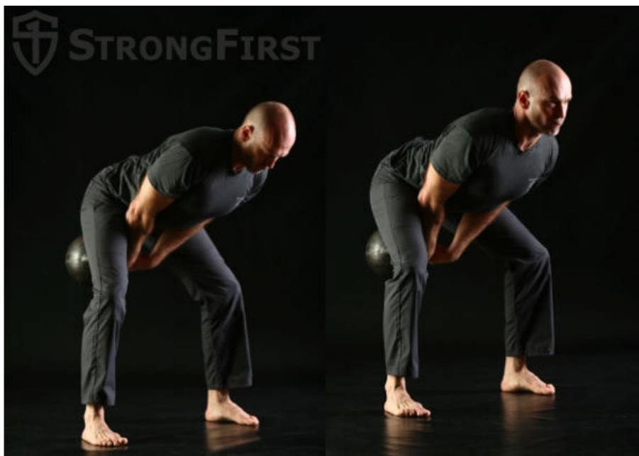
Obr. 5 Spodní finální poloha swingu s pohledem vpřed! Pravá figura.

3) spodní část – důraz na stabilizování polohy, udržet celou dobu chodidla pevně na zemi, stahovat ramena dolů od uší a protlačovat hrudní kost směrem k bodu na který se dívám (mírně před sebe – obr. 5 pravá figura!)