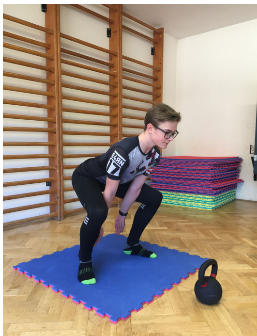
Obr. 1 Nácvik kyčelního ohybu a spodní části cviku.