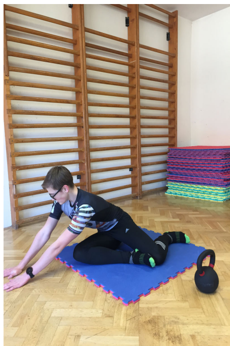
Obr. 2 Uvolnění kyčelních kloubů.